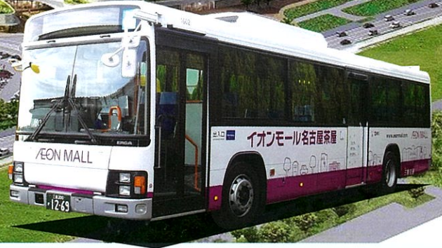
名古屋(名鉄バスセンター)案内図