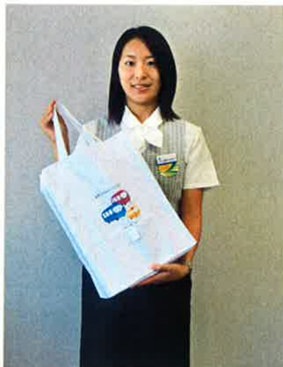
「セバスファミリー・エコバック」