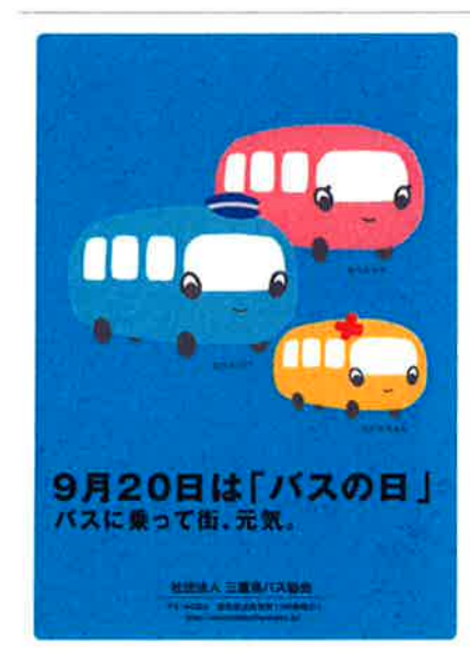
「セバスファミリー・クリアファイル」