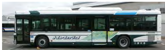
ハイブリッドバス専用カラーリング