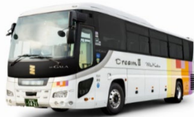
ボランティアバス （イメージ）

三重交通グループは、母体である三重交通の創立（昭和19年2月）から数えて、令和6年2月に創立80周年を迎えます。当社グループでは本イベントへの参加・協力を始めとして様々な記念行事を実施してまいります。詳細が決まり次第、随時、ホームページ等でお知らせします。