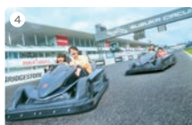
4 鈴鹿サーキット