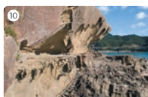
10 鬼ヶ城(鬼ヶ城東口)