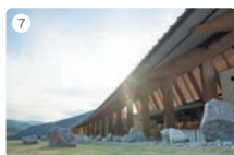
7 VISON