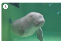
8 鳥羽水族館