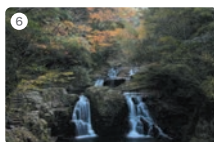
6 赤目四十八滝(赤目滝)