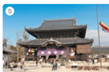
5 高田本山専修寺(本山前)