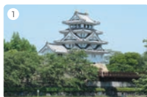
1 墨俣一夜城(墨俣)