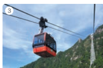
3 御在所ロープウェイ