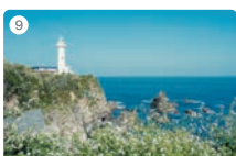
9 大王埼灯台