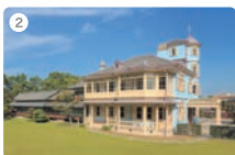
2 六華苑(田町)